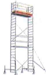
STABILO® S100 Professional