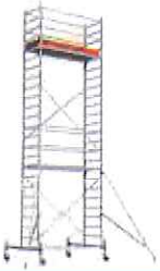
STABILO® S10 Professional