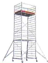
STABILO® S50 Professional